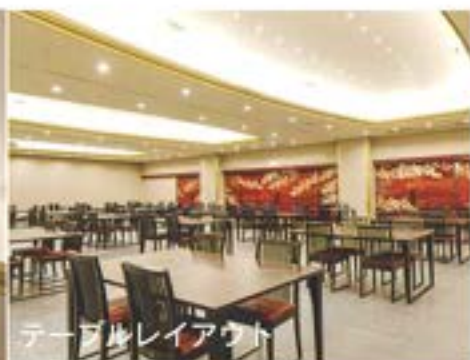
テーブルレイアウト